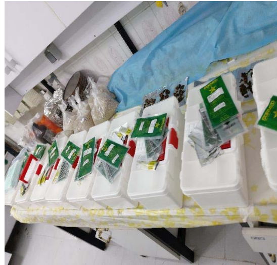
وسایل نمونه برداری

نمونه‌ای از تجهیزات خریداری شده برای بانک ژن