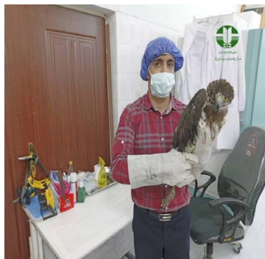
تیمار، نگهداری و رهاسازی یک بهله عقاب مارخوار