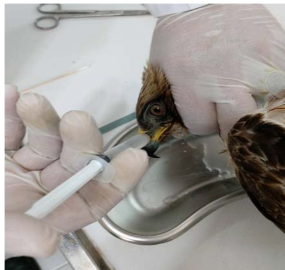
درمان اولیه و شست و شوی بینی یک بال عقاب پرپا