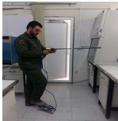
سلاح زنده گیری