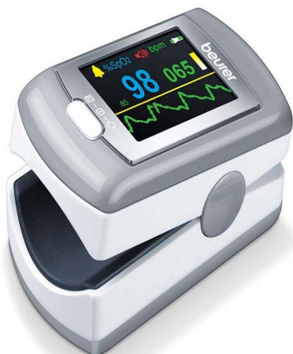
دستگاه پالس اکسی متر