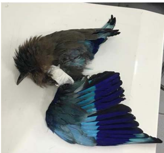
درمان شکستگی بال سبز قبای هندی