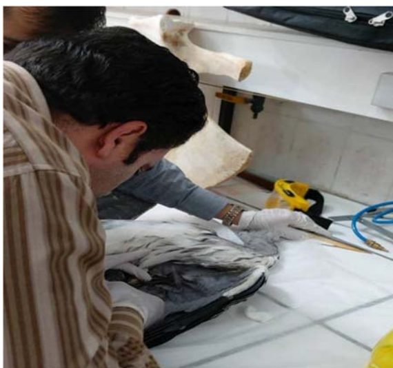
تیمار و رهاسازی یک فرد پلیکان پاخاکستری