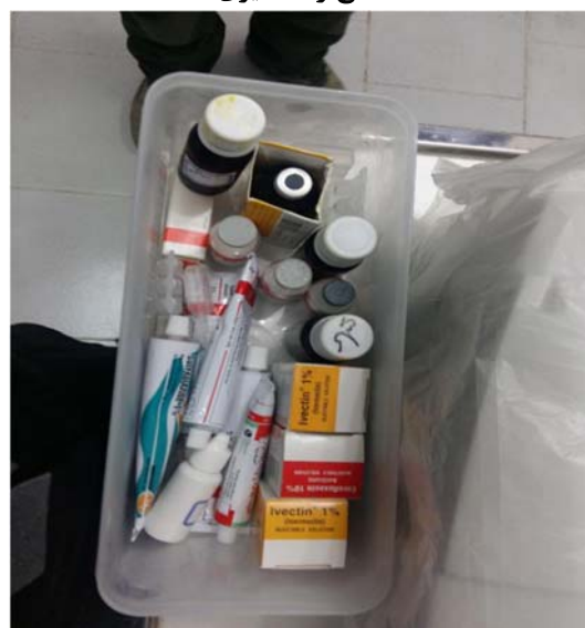
داروهای وسیع الطیف