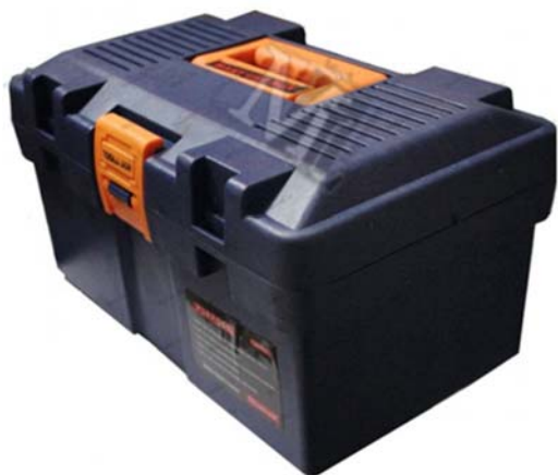
جعبه نگهداری دارو

نمونه ای از تجهیزات تهیه شده بر ای نقاهتگاه در سال ۹۸